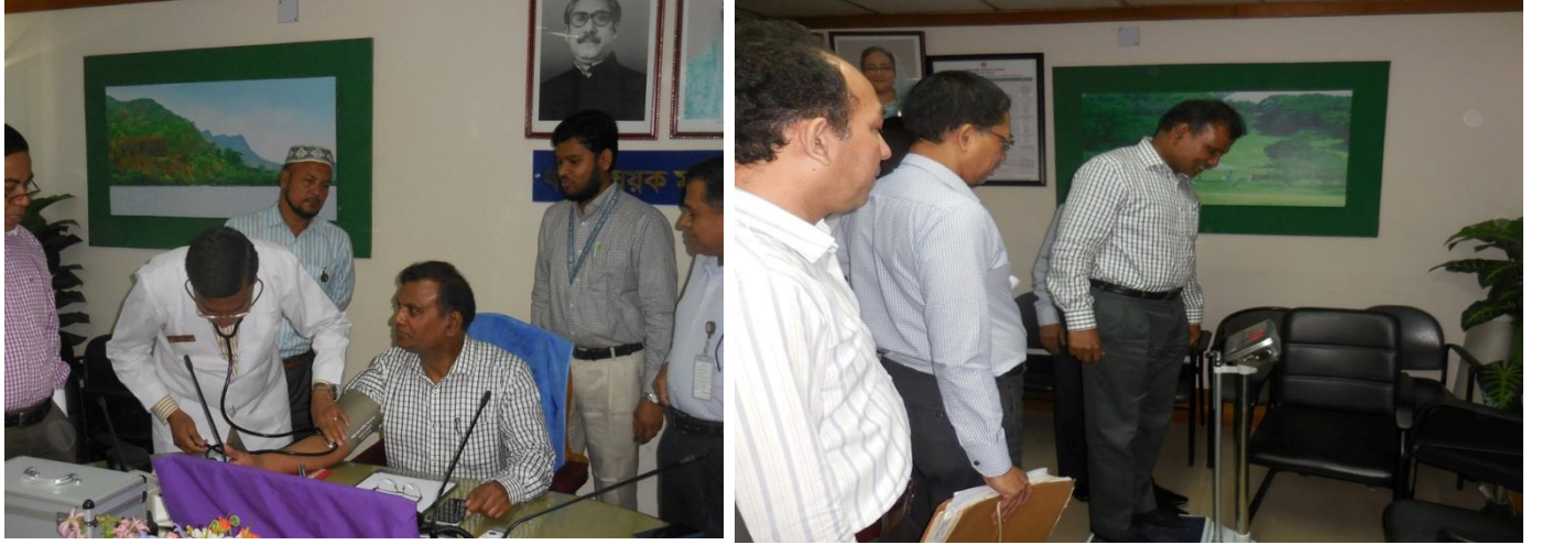
স্বাস্থ্য সচেতনতা বিষয়ক উদ্ভাবনী উদ্যোগ

এই উদ্যোগ এর ফলে কি উপকার/উন্নয়ন হয়েছেঃ এর মাধ্যমে একজন কর্মকর্তা কর্মব্যস্ত জীবনেও সফল ও সুন্দরভাবে সকল মানসিক ও শারীরিক সুস্থতার মাধ্যমে প্রতিষ্ঠান ও জনগণকে সেবা প্রদান করতে পারবেন।