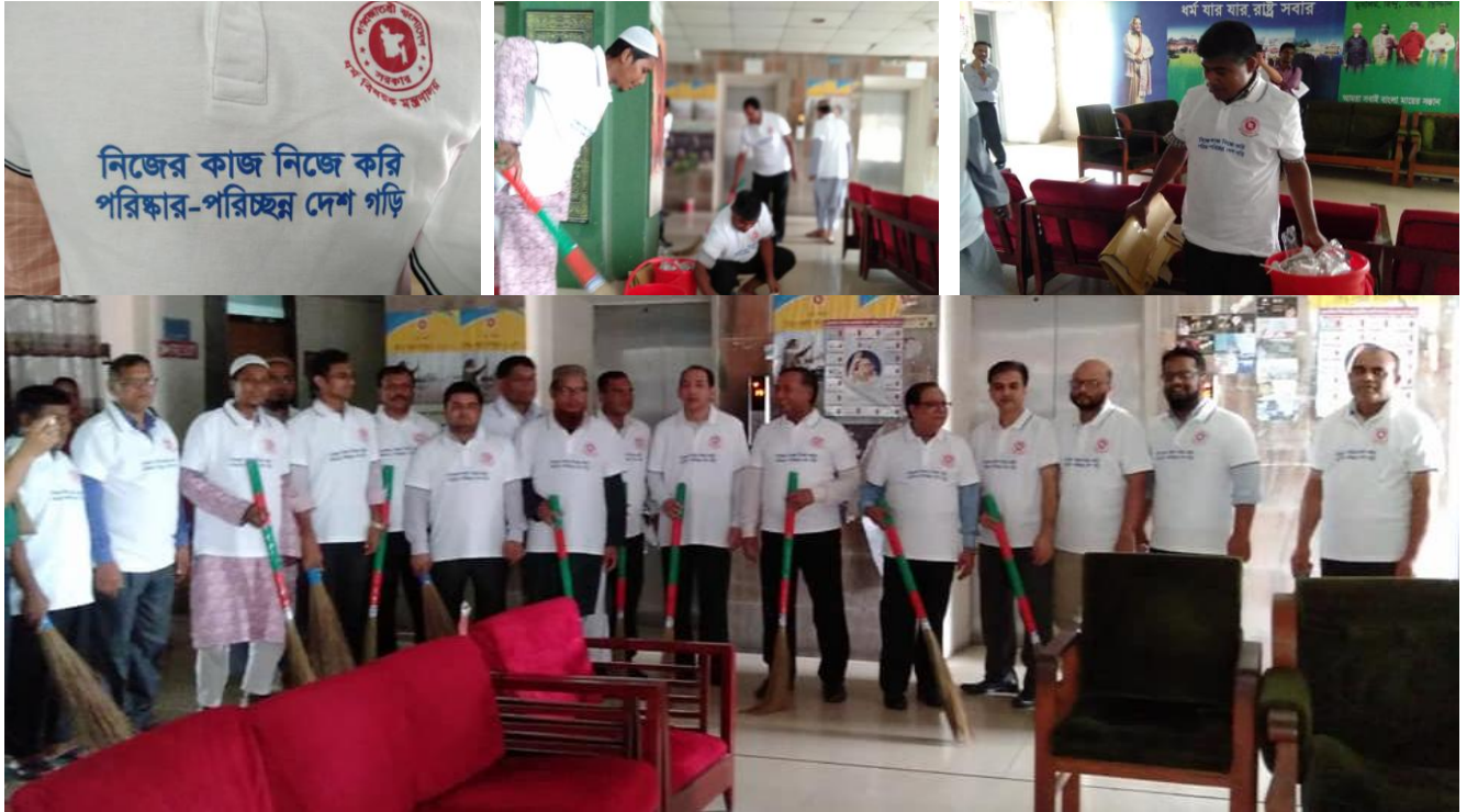
প্রতিষ্ঠানের পরিষ্কার-পরিচ্ছন্নতা অভিযান

উক্ত উদ্ভাবনী উদ্যোগ মন্ত্রণালয়ে চালু করা হয়েছে এবং আওতাধীন দপ্তর সমূহে চালু করার জন্য নির্দেশনা প্রদান করা হয়েছে। এই উদ্যোগ এর ফলে কি উপকার/উন্নয়ন হয়েছেঃ নিজ কর্মস্থল পরিষ্কার পরিচ্ছন্নতা রাখার ফলে একটি সুন্দর কর্মপরিবেশ সৃষ্টি হয়েছে।