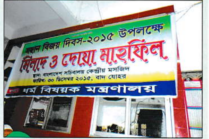
মহান বিজয় দিবস-২০১৫ উপলক্ষে মিলাদ ও দোয়া মাহফিল।

ইসলাম ধর্মের পাঁচ মূল স্তম্ভের মধ্যে হজ একটি অন্যতম প্রধান স্তম্ভ। হজ একটি স্পর্শকাতর ধর্মীয় বিষয়, যার সাথে ধর্মীয় অনুভূতি জড়িত। এ বিশাল কর্মকাণ্ড বাংলাদেশ সরকারের পক্ষে ধর্ম বিষয়ক মন্ত্রণালয় সম্পাদন করে থাকে। বর্তমান সরকার দায়িত্ব গ্রহণের পর হজ ব্যবস্থাপনায় ব্যাপক গুণগত পরিবর্তন এসেছে; যা দেশে-বিদেশে সর্বোপরি প্রিন্ট ও ইলেক্ট্রনিক মিডিয়ায় প্রশংসিত হয়েছে।