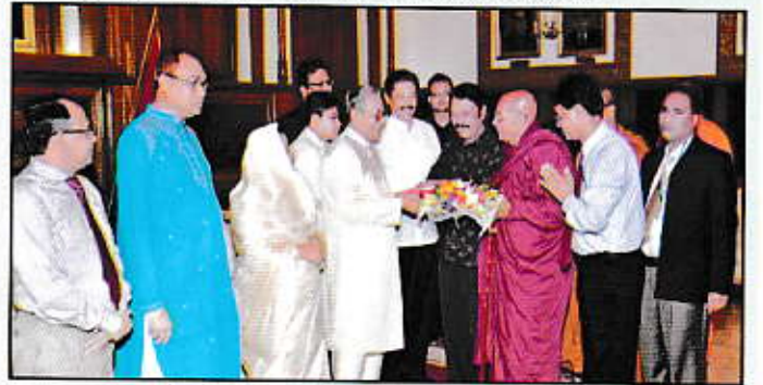
মহামান্য রাষ্ট্রপতির সাথে শুভেচ্ছা বিনিময় করতে দেখা যাচ্ছে বৌদ্ধ সম্প্রদায়ের ধর্মীয়গুরু ও বিশিষ্ট ব্যক্তিবর্গ।

দেশের বৌদ্ধ জনসাধারণের ধর্মীয় কল্যাণ সাধনের লক্ষ্যে ১৯৮৩ সনের ৬৯ নম্বর রাষ্ট্রপতির অধ্যাদেশ-এর ৩ ধারার বিধান অনুসারে ১৬ই জানুয়ারী, ১৯৮৪ সনে বৌদ্ধ ধর্মীয় কল্যাণ ট্রাস্ট প্রতিষ্ঠিত হয়। বৌদ্ধ ধর্মীয় উপাসনালয়ের রক্ষণাবেক্ষণ ও মেরামতের জন্য আর্থিক সহায়তা প্রদানের মাধ্যমে বৌদ্ধ ধর্ম চর্চার ক্ষেত্র তৈরী, সামগ্রিক উন্নয়ন, উপাসনালয়ের পবিত্রতা রক্ষা প্রভৃতি কার্যগুলো সুচারুরূপে সম্পাদনের লক্ষ্যে যাবতীয় পদক্ষেপ গ্রহণ করাই এ ট্রাস্টের প্রথম ও প্রধান কাজ। বর্তমান গণতান্ত্রিক মহাজোট সরকার ক্ষমতা গ্রহণের পর থেকে সরকারের সদৃষ্টি ও সক্রিয় সহযোগিতায় ট্রাস্ট এর কার্যক্রম ও কর্মতৎপরতা ব্যাপক বিস্তৃতি লাভ করেছে। এর ফলে বৌদ্ধ ধর্মের প্রচার প্রসার বৃদ্ধি পেয়েছে। বৌদ্ধ ধর্মীয় ঐতিহাসিক পটভূমি, সংস্কৃতি ও ঐতিহ্য বাংলাদেশের ঘরে ঘরে প্রতিধ্বনিত হচ্ছে।