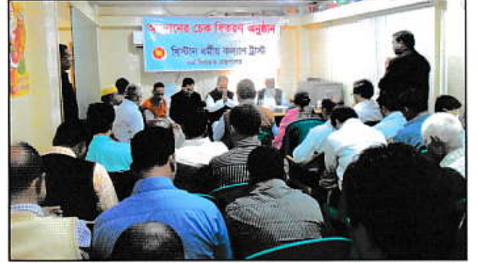
খ্রিস্টান ধর্মীয় কল্যাণ ট্রাস্ট কর্তৃক অনুদানের চেক বিতরণ অনুষ্ঠান

৫ নভেম্বর ২০০৯ খ্রিস্টাব্দে খ্রিস্টান ধর্মীয় কল্যাণ ট্রাস্ট প্রতিষ্ঠার পর থেকে এ পর্যন্ত বিভিন্ন গির্জা, কবরস্থান ও ধর্মীয় প্রতিষ্ঠানসমূহের নির্মাণ, মেরামত, সংস্কার, মাটিভরাট ও উন্নয়নের কাজের জন্য এই পর্যন্ত ১৩৩টি চার্চ, কবরস্থান ও ধর্মীয় প্রতিষ্ঠানের অনুকূলে ১ কোটি ২০ লক্ষ ৫৫ হাজার টাকার অনুদান বিতরণ করেছে।