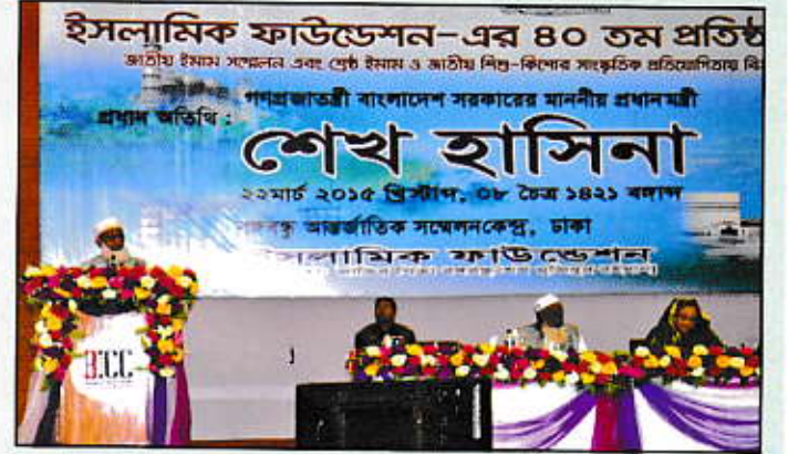
ইসলামিক ফাউন্ডেশন-এর ৪০তম প্রতিষ্ঠা বার্ষিকী অনুষ্ঠানে প্রধান অতিথি হিসেবে উপস্থিত আছেন গণপ্রজাতন্ত্রী বাংলাদেশ সরকারের মাননীয় প্রধানমন্ত্রী শেখ হাসিনা

গণপ্রজাতন্ত্রী বাংলাদেশ সরকারের ধর্ম বিষয়ক মন্ত্রণালয়ের অধীনে ইসলামিক ফাউন্ডেশন একটি বিধিবদ্ধ স্বায়ত্বশাসিত সংস্থা। বাংলাদেশের মহান স্থপতি জাতির পিতা বঙ্গবন্ধু শেখ মুজিবুর রহমান ১৯৭৫ সালের ২২ মার্চ এক অধ্যাদেশবলে ইসলামের মহান আদর্শ ও মূল্যবোধের প্রচার ও প্রসার কার্যক্রমকে বেগবান করার লক্ষ্যে 'ইসলামিক ফাউন্ডেশন' প্রতিষ্ঠা করেন। ২৮ মার্চ ১৯৭৫ সালে 'ইসলামিক ফাউন্ডেশন এ্যাক্ট ১৯৭৫' প্রণীত হয়। বাংলাদেশের সংখ্যাগরিষ্ঠ মানুষ মুসলমান এবং প্রাচীনকাল থেকে এ দেশে ইসলামী আদর্শ ও মূল্যবোধের লালন এবং চর্চা হয়ে আসছে। এ লক্ষ্যে ইসলামিক ফাউন্ডেশন তার উপর অর্পিত দায়িত্ব যথাযথভাবে পালন করে যাচ্ছে। বর্তমানে ইসলামিক ফাউন্ডেশন-এর বিভিন্ন কার্যক্রম প্রধান কার্যালয়ের ১৪টি বিভাগ, ৬৪টি বিভাগীয় ও জেলা কার্যালয়, ৭টি ইমাম প্রশিক্ষণ একাডেমী এবং ৩৯টি ইসলামিক মিশন কেন্দ্রের মাধ্যমে বাস্তবায়িত হচ্ছে।