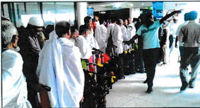
বিমানে ওঠার পূর্বকক্ষে সারিবদ্ধ হজযাত্রীগণ